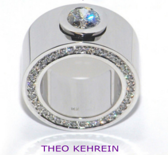
THEO KEHREIN Manufaktur feiner Juwelen www.schmuck-projekt.de