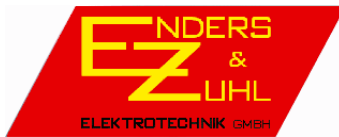
Hauptstraße 44, 55546 Hackenheim www.enderszuhl-elektro.de