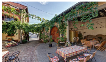
Winzerhof Grünwald-Schima www.weintreff-gs.de